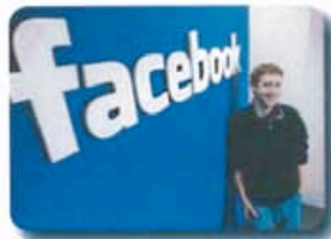
Mark & Facebook